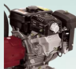
Двигатель Subaru 126cc