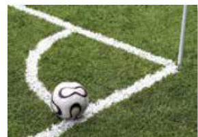
Разметка на спортивных площадках, футбольных полях и т.д.