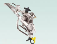
Съемный пистолет распылитель LX-80"