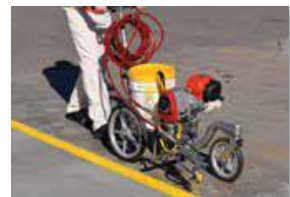
Разметка парковок, дорог, тротуаров, во дворах