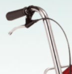
Ручки управления распылительным пистолетом